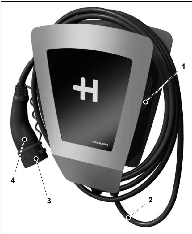
Abb. 1 Ladesystem

Schutzeinrichtungen sind die folgenden Bestandteile: