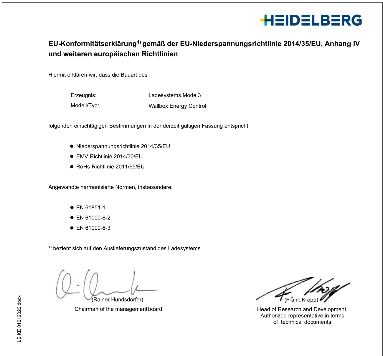
Abb. 3 Konformitätserklärung

Belgien, Bulgarien, Dänemark, Deutschland, Estland, Finnland, Frankreich, Griechenland, Irland, Italien, Kroatien, Lettland, Litauen, Luxemburg, Malta, Niederlande, Österreich, Polen, Portugal, Rumänien, Slowakei, Slowenien, Spanien, Schweden, Tschechische Republik Ungarn, Vereinigtes Königreich, Zypern